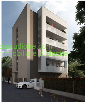
Visita da lato Nord Est

www.agenziastudiotre.com la Tua agenzia immobiliare a Mestre